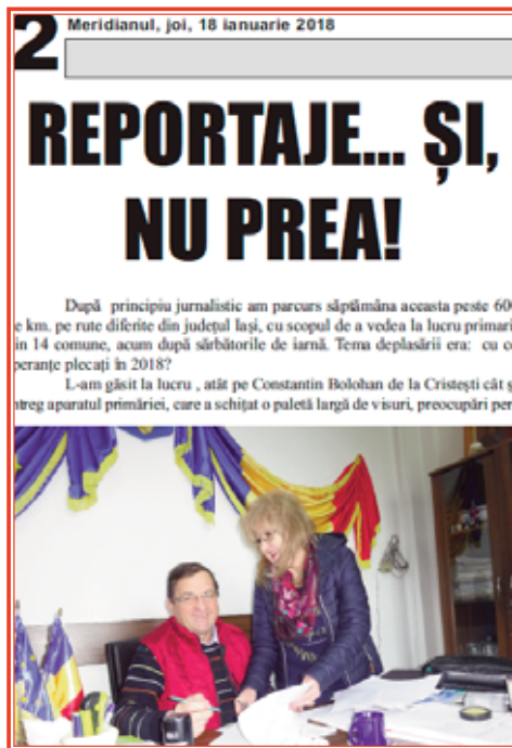
La primăria Cristești – început de an 2018

... Pe 18 ianuarie 2018, joi, consemnam alte visuri ale