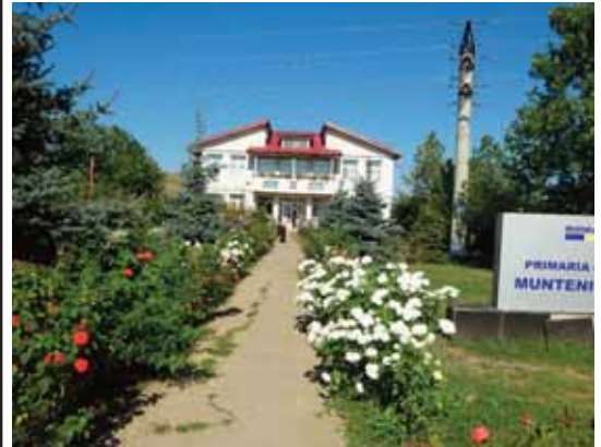
Primăria MUNTENII DE SUS

Comuna cea cunoscută în județ datorită cetelor de dansatori, mai are și alte activități pentru care să iasă în evidență. Deocamdată, nu poate să arate cum stau cu sportul, în special cu fotbalul, pentru că există în fața primăriei un foarte frumos teren de fotbal, până la urmă locul de autoritate pentru una dintre cele mai titrate echipe de fotbal, alături de Zăpodeni și Laza.